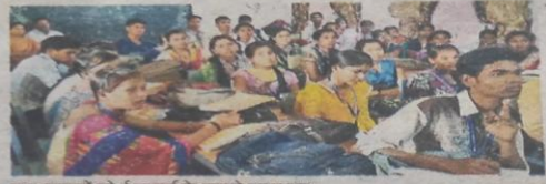
छात्र-छात्राओं को ई कॉमर्स के फायदे बताए गए।

ई कॉमर्स में रोजगार की असौम्य संभावनाएं हैं। इससे व्यापारिक लेन देन में भी कोई अड़थक नहीं होती। पारंपरिक व्यवस्था की तुलना में इससे व्यापार करने में सुविधा होगी। बिना दुकान खोले अपने व्यापार को अंतरराज्यीय एवं अंतरराष्ट्रीय स्तर पर फैला सकते हैं। कम पूंजी में अधिक लाभ कमा सकते हैं।